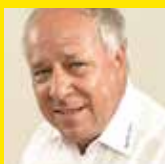
Harald Zecchin Veranstaltungen