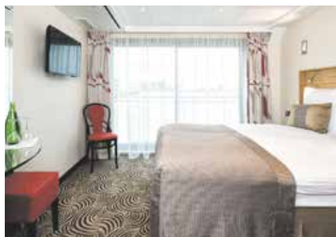
2-Bettkabine Mitteldeck und Oberdeck mit franz. Balkon

* im Ausflugspaket (9 Ausflüge Fr. 290.-) enthalten, vorab buchbar | Programmänderungen vorbehalten Reederei/Partnerfirma: Scylla AG